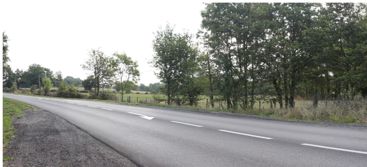
Photographie de l'état initial à 50°